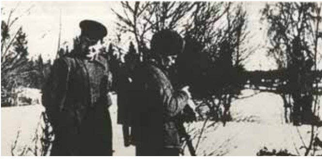
Ю.В. Андропов среди партизан-разведчиков на боевых занятиях (Карельский фронт). 1943 г. Центральный архив ФСБ России. Ф. А. Оп. 2. Д. 11.