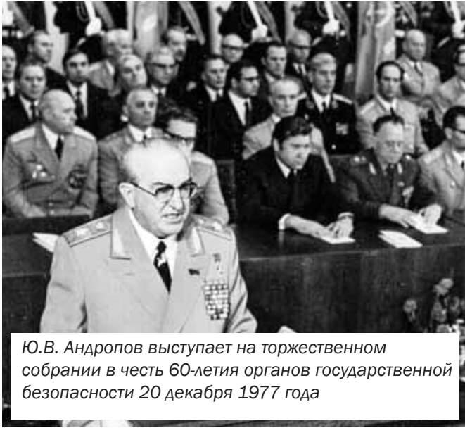
Ю.В. Андропов выступает на торжественном собрании в честь 60-летия органов государственной безопасности 20 декабря 1977 года