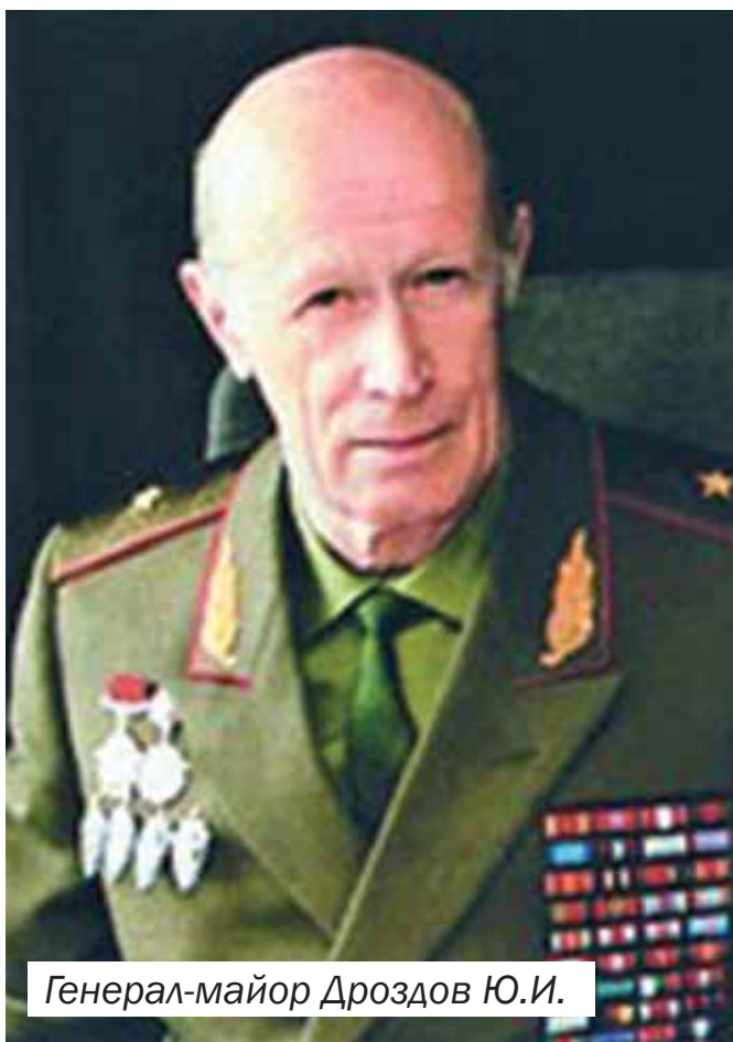
Генерал-майор Дроздов Ю.И.