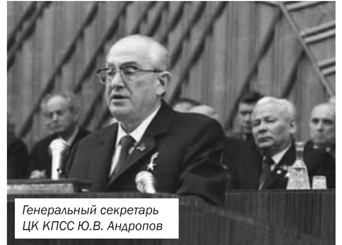
Генеральный секретарь ЦК КПСС Ю.В. Андропов

→ партизанских баз и тайников с оружием и продовольствием, на встречи с партизанами и разведчиками. Может быть, потому, как свидетельствуют некоторые мемуары, именно в эти суровые годы в холодной болотистой Карелии он, уроженец юга, приобрел ту болезнь почек, которая так осложняла всю оставшуюся его жизнь.