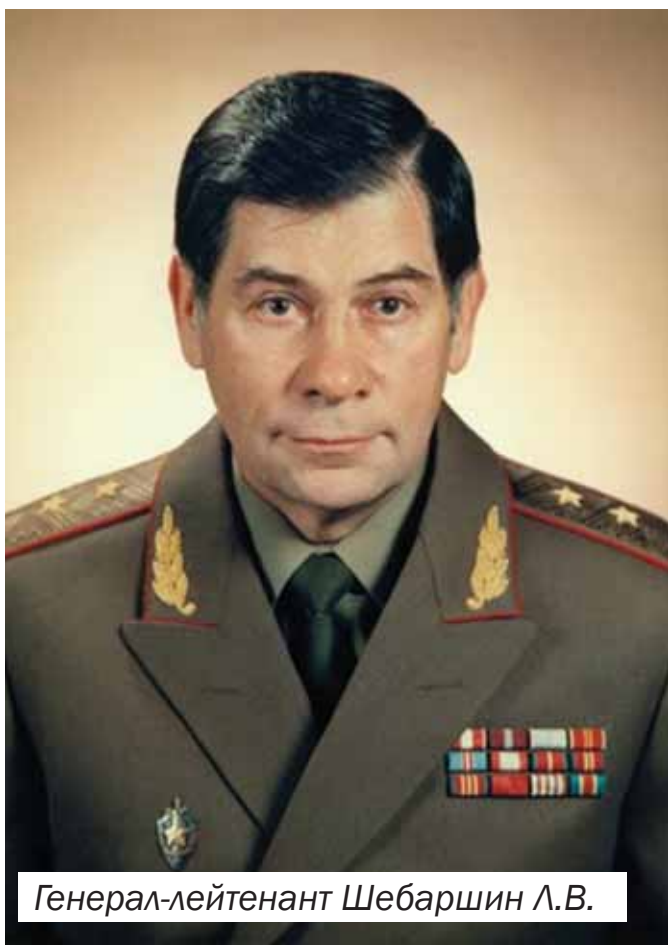
Генерал-лейтенант Шебаршин Л.В.

Юрии Владимировиче: «Он жил проблемами нелегальной разведки, думал вместе с нами о путях ее развития. Много, о чем он говорил, мы постарались воплотить в жизнь. Он знал, сколь сложно и опасно ремесло нелегальной разведки. Андропов внимательно следил за ходом нелегальных операций, некоторые знал в деталях. Иногда ему не терпелось узнать что-то новое, но он останавливал себя, подчиняя свое желание условиям связи и строжайшей конспирации».