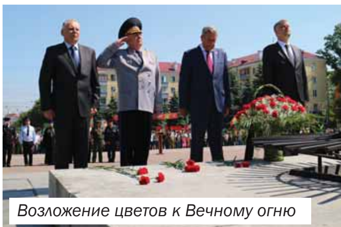
Возложение цветов к Вечному огню