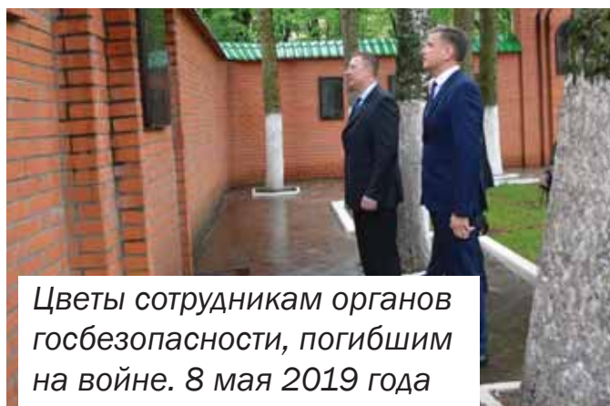
Цветы сотрудникам органов госбезопасности, погибшим на войне. 8 мая 2019 года

День Победы! Как много в этих словах. В них горечь слез и потерь, в них радость встреч и достижений. Ведь события тех страшных лет коснулись каждой семьи, каждого человека. От той Великой Победы нас отделяют 74 года. Каждый год в начале мая все россияне с уважением и трепетом вспоминают подвиг своих отцов и дедов.