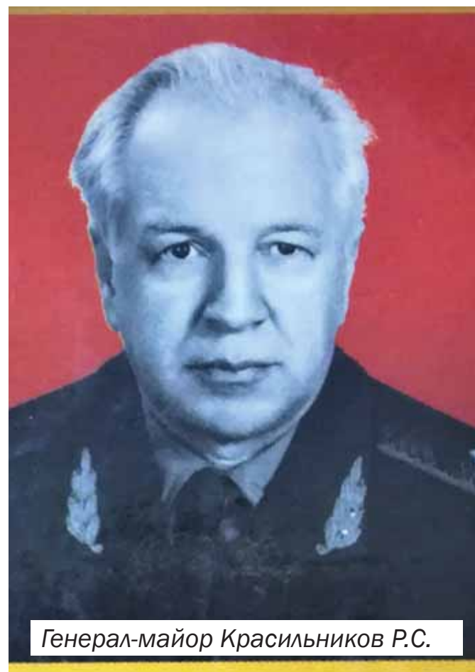
Генерал-майор Красильников Р.С.