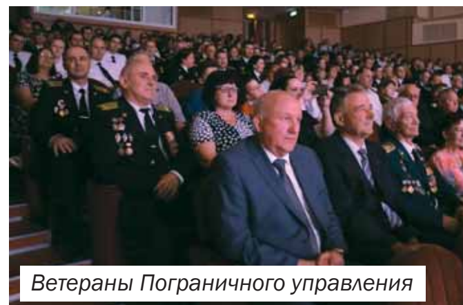
Ветераны Пограничного управления