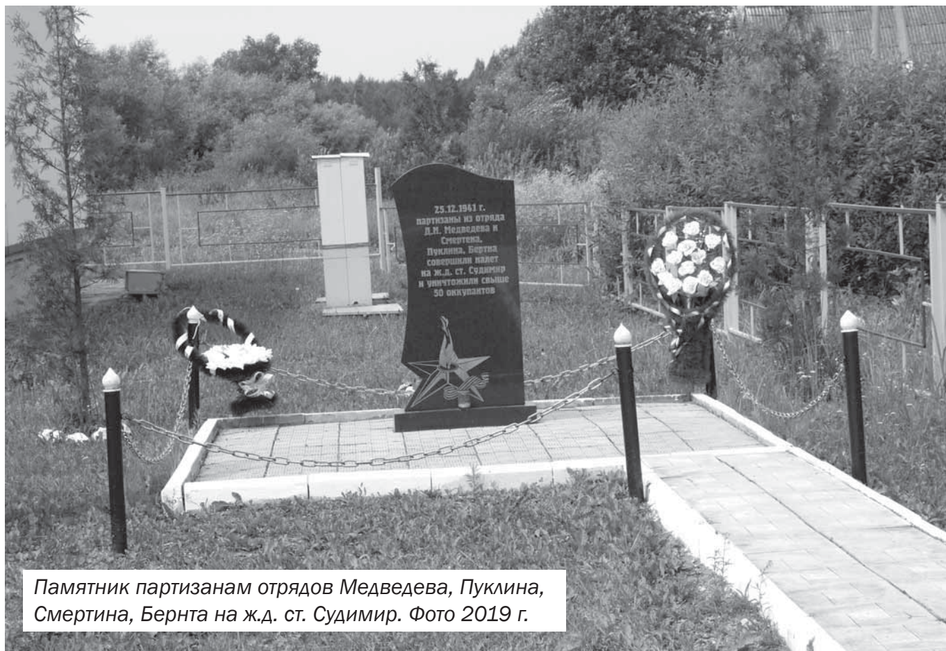
Памятник партизанам отрядов Медведева, Пуклина, Смертина, Бернта на ж.д. ст. Судимир. Фото 2019 г.

→ и передвижениях воинских подразделений вермахта, о чем в Центр передано десятки донесений, проведено свыше 50 боевых операций на коммуникациях противника, уничтожено большое количество карателей, военной техники врага.