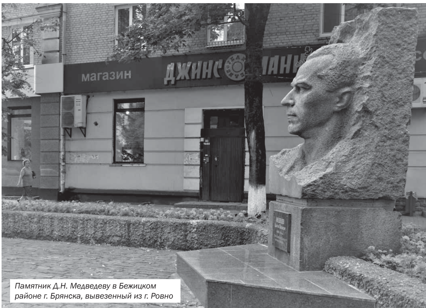
Памятник Д.Н. Медведеву в Бежицком районе г. Брянска, вывезенный из г. Ровно

Отрядом «Митя» под командованием Д.Н. Медведева на территориях оккупированной Брянщины, Калужской и Могилевской областей добывалась разведывательная информация о дислокации →