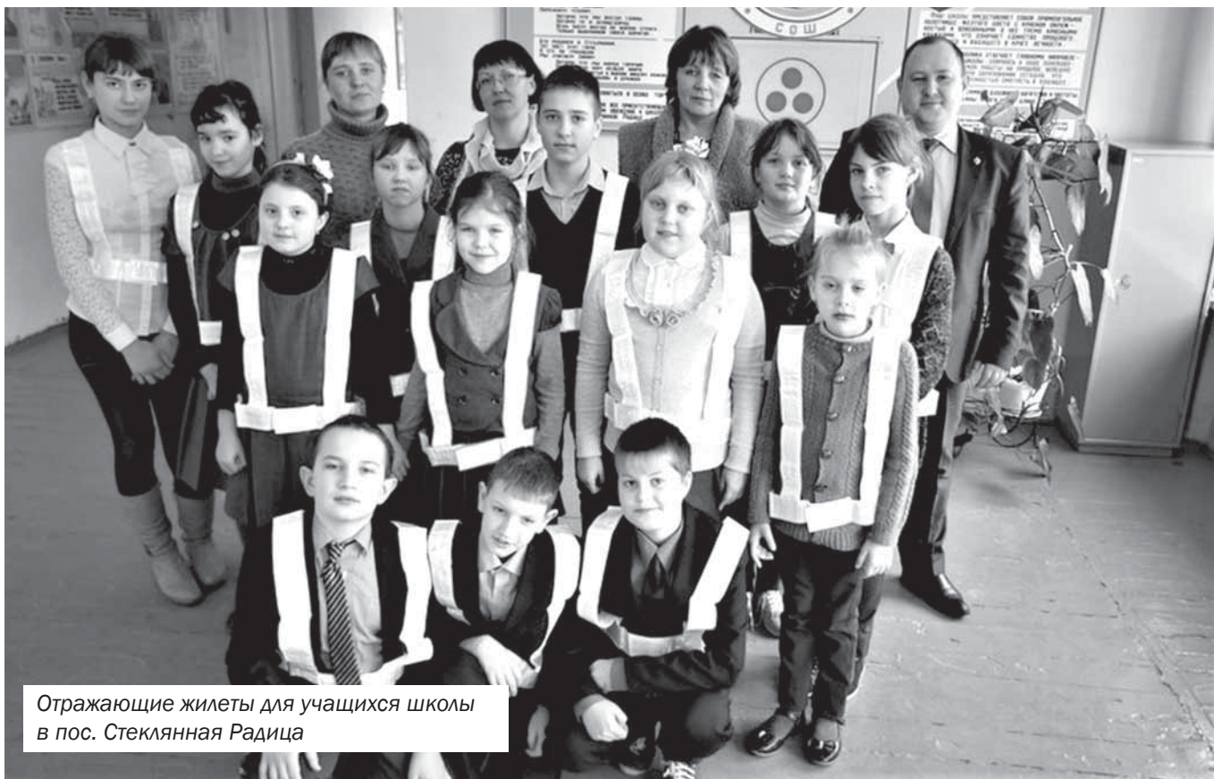
Отражающие жилеты для учащихся школы в пос. Стекланная Радица

→ и организации осеннего призыва, проходящего в историко-краеведческом музее Брянского района в пос. Мичуринском. Уходя на службу помимо напутствий ребята получают памятные сувениры. На постоянной основе оказывается материальная помощь поисковым организациям города в части выделения средств на проведение поисковых мероприятий по выявлению и благоустройству воинских захоронений (приобретение инвентаря, оплата бензина и т.д.), извлечению погребенной в болотах техники, проведение вахт памяти. Найденные экспонаты боевой техники (частей самолетов и танков) отправляются в музей в виде экспонатов, которые активно используются в воспитательных процессах молодежи.