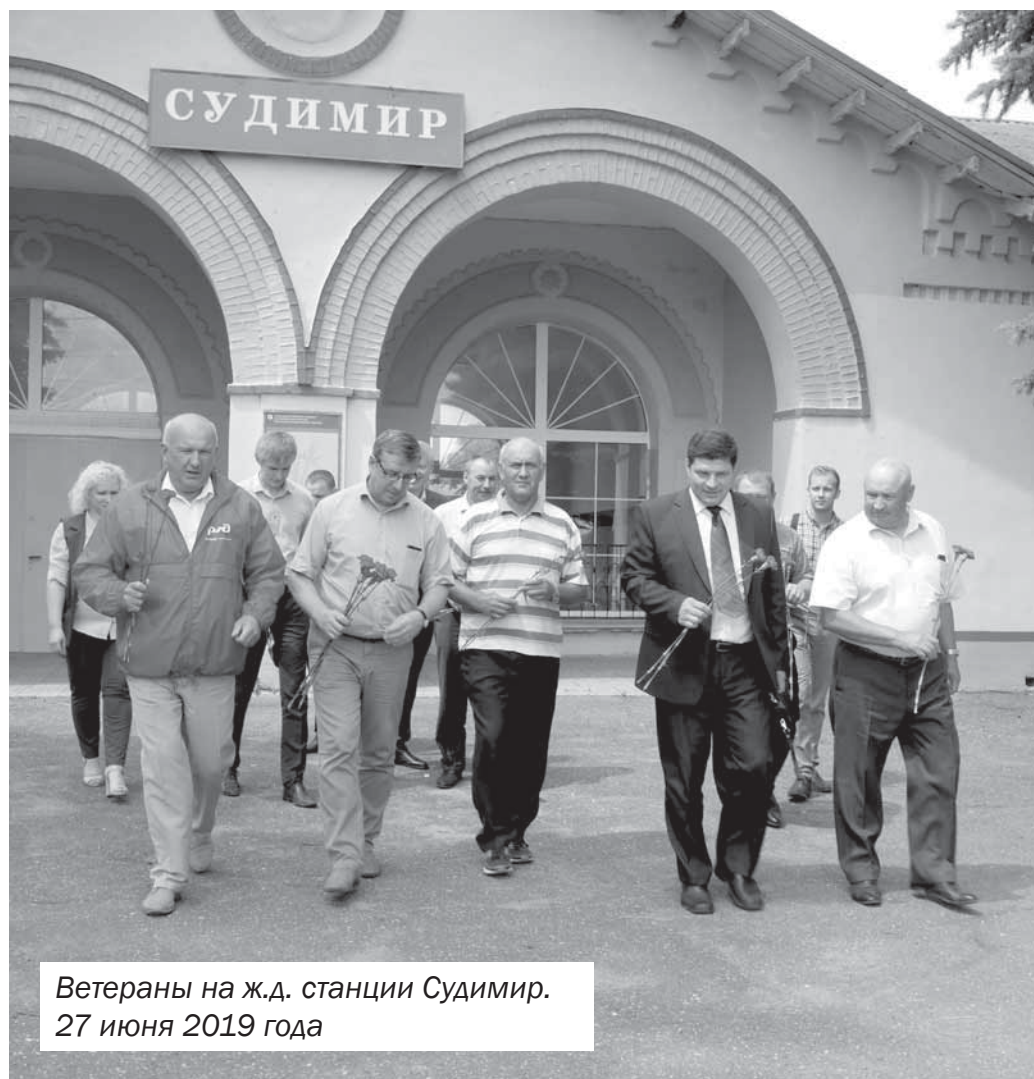
Ветераны на ж.д. станции Судимир. 27 июня 2019 года