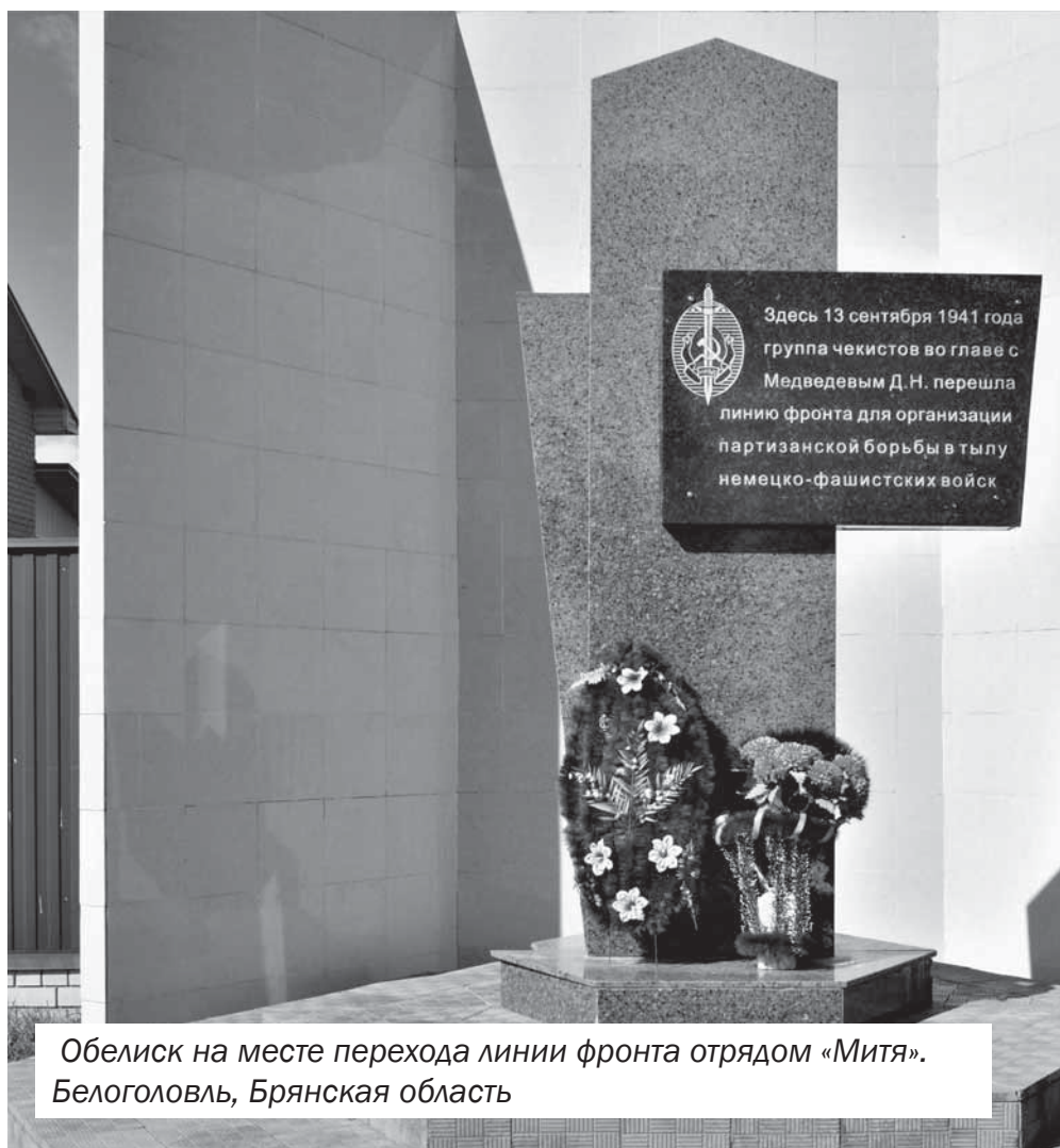
Обелиск на месте перехода линии фронта отрядом «Митя». Белоголовль, Брянская область