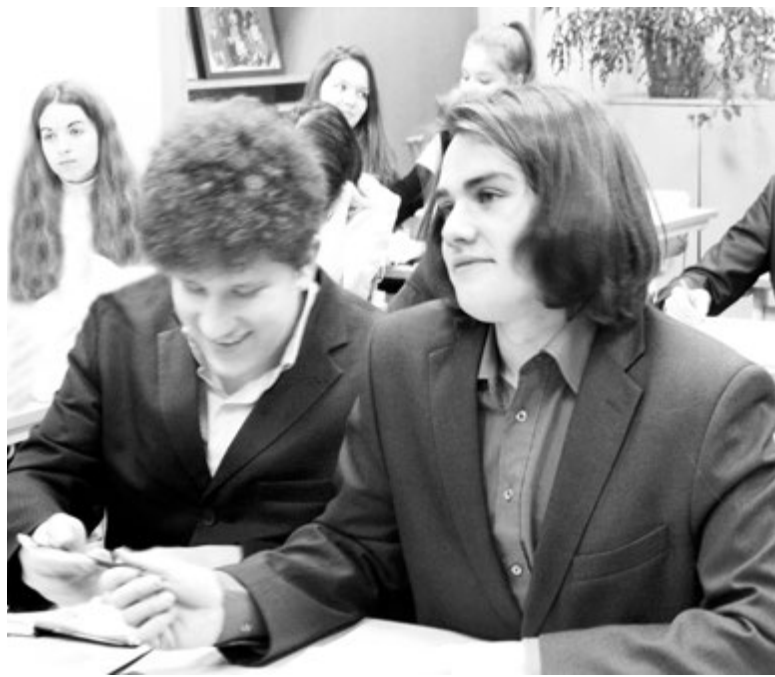
Каждый лицеист может выбрать клуб по душе

Лицейские клубы делают жизнь интереснее и ярче