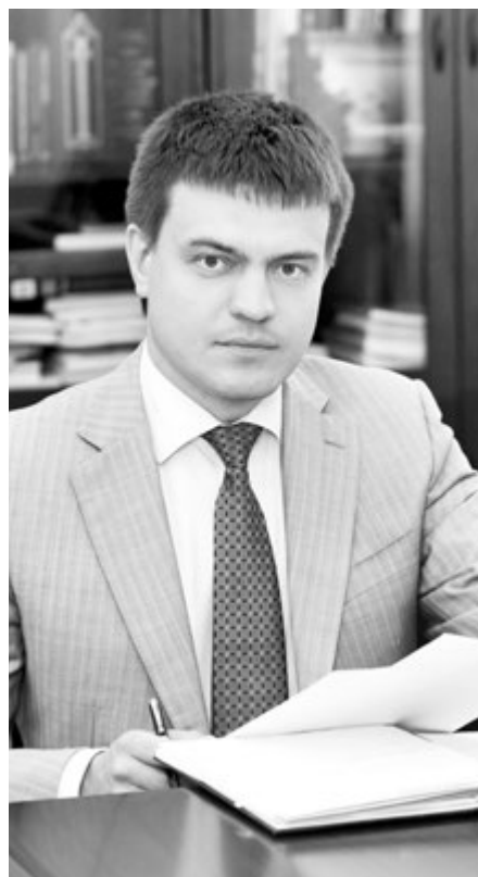
Михаил КОТЮКОВ, министр науки и высшего образования

Примечательно что Михаил Котюков участвовал в образовательной программе РАНХиГС. Кстати, участникам программы, словно спартамцам перед нашествием персов, приходилось прыгать со скалы, учиться стрельбе, ложиться под движущуюся технику, а еще плавать на лодках-драконах. И все это в рамках спецтренингов, организованных РАНХиГС по поручению Администрации Президента РФ. Михаил Михайлович женат, воспитывает сына и дочь, свободное время предпочитает проводить с семьей, любит бывать на природе.