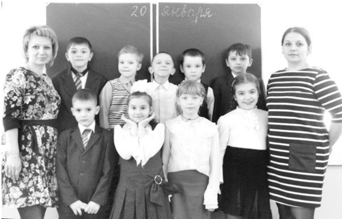
Школу, где всего 19 детей, можно по праву назвать домашней, теплой

Благодаря благотворительным фондам у филиала сейчас есть компьютеры, сканеры, принтеры, новая школьная мебель. Но больше всего учителя хотели бы, чтобы в школе появилось больше детей. Сегодня же особенно важно сохранить эту небольшую школу на селе.