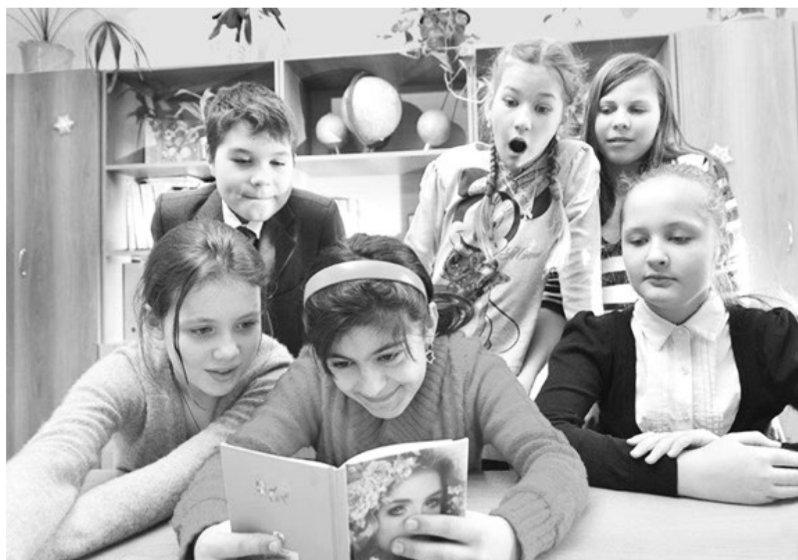
Чтение с увлечением

Живите ярко, развивайтесь профессионально, становитесь соавторами своей профессиональной газеты!