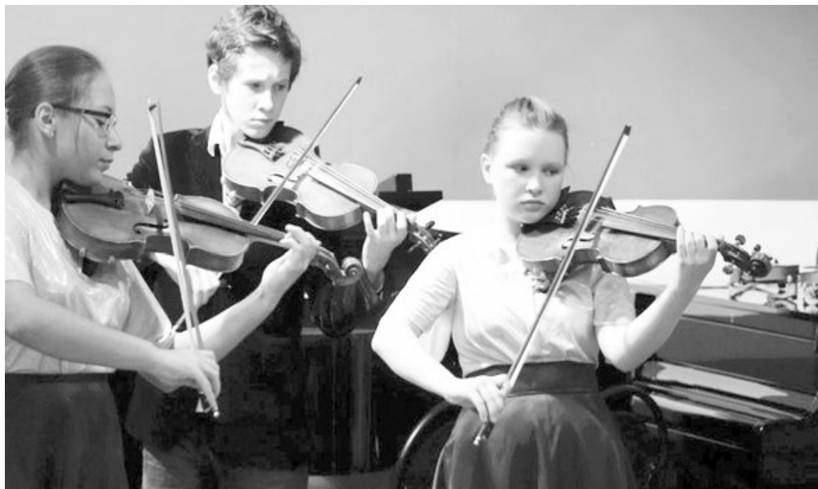
«Счастлив дом, где звуки скрипки наставляют нас на путь...» Булат Окуджава

Другой не менее известный проект, тоже просветительской направленности - «Музыкальная го-