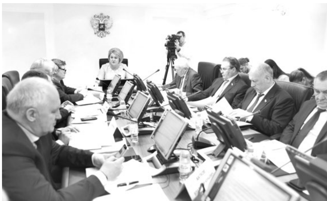
Комитет по науке, образованию и культуре Совета Федерации рассмотрел вопросы детского отдыха

18 мая заместитель Председателя Правительства РФ Татьяна Голикова представила коллективам преобразованного Минобрнауки России и упраздненного Федерального агентства научных организаций руководителям двух новых ведомств: главу Министерства просвещения РФ Ольгу Васильеву и главу Министерства науки и высшего образования РФ Михаила Котюкова. Вице-премьер представила биографии министров и обозначила стратегические задачи, стоящие перед новыми ведомствами, среди которых реализация 12 приоритетных проектов в сфере образования и науки. Как напомнила Татьяна Голикова, предложения по выполнению поставлен-