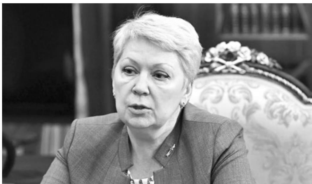
Ольга ВАСИЛЬЕВА, министр просвещения Российской Федерации